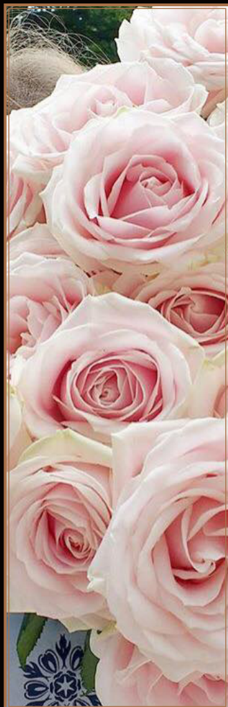
Sweet Avalanche+ ®

Heel bijzondere exemplaren hebben op een van de buitenste bloemblaadjes een kleine rode 'kus' die de roos nog meer personality geeft.