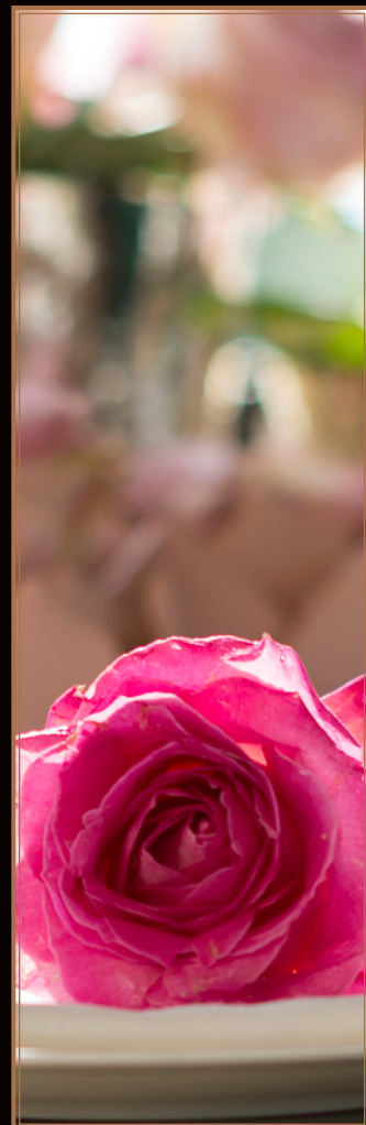
Candy Avalanche+ ®

Stralende persoonlijkheid met een vrolijke uitstraling die in arrangementen het verschil maakt dankzij de unieke kleur. Die is warm en vrolijk als een zomerdag, in poederig perzik, en de roos voelt al even zacht als haar naam suggereert.